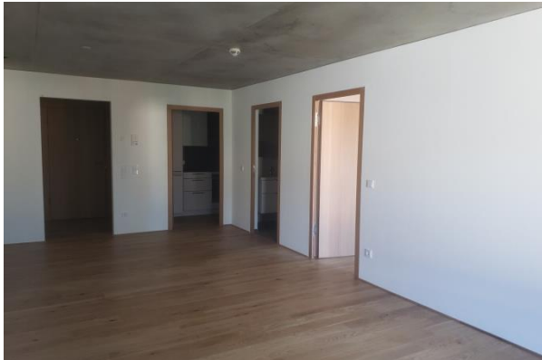
Wohnraum Blickrichtung Garderobe, Küche, Bad