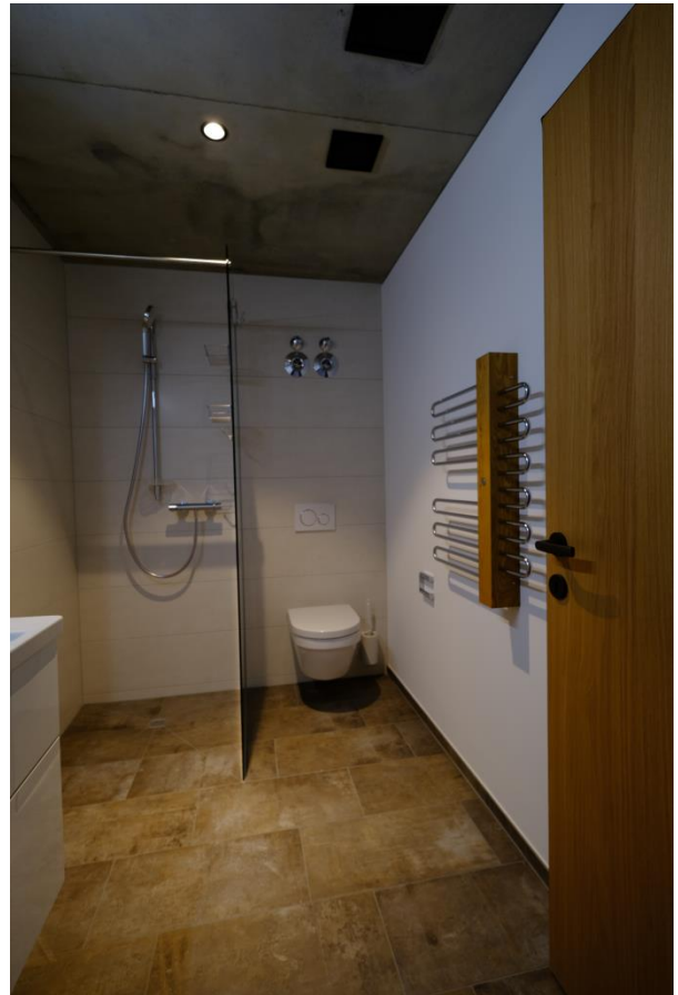
Bad mit Spiegelschrank, Waschtisch, Dusche, WC und Handtuchrockner „Jodok“