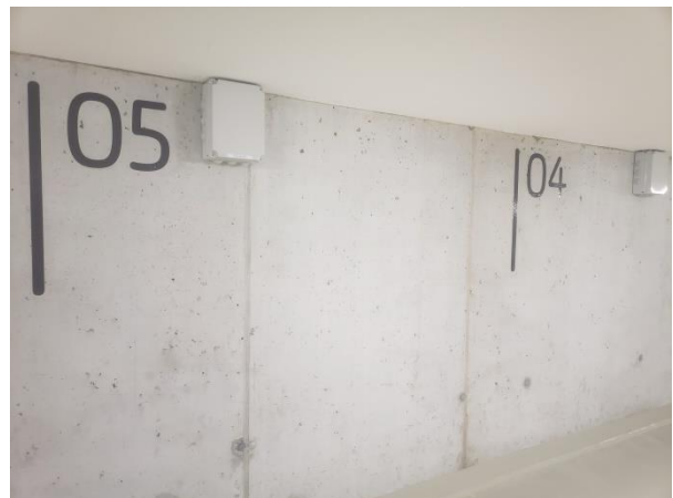
Abstellplätze e-mobility ready