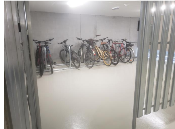
Fahrradräume – Erdgeschoss und Tiefgarage