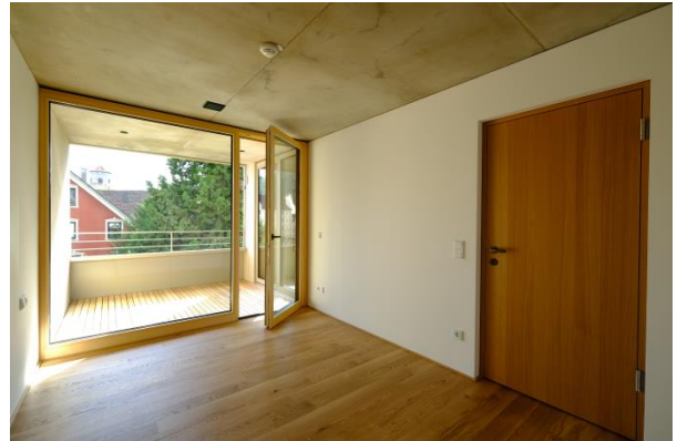
Blick vom Schlafzimmer zur Loggia