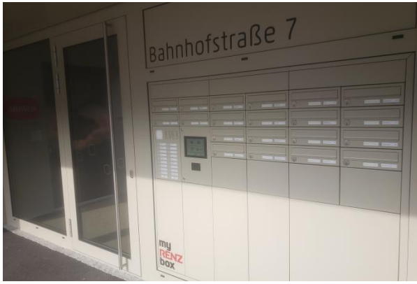
Eingangsbereich mit elektronischer Paketbox