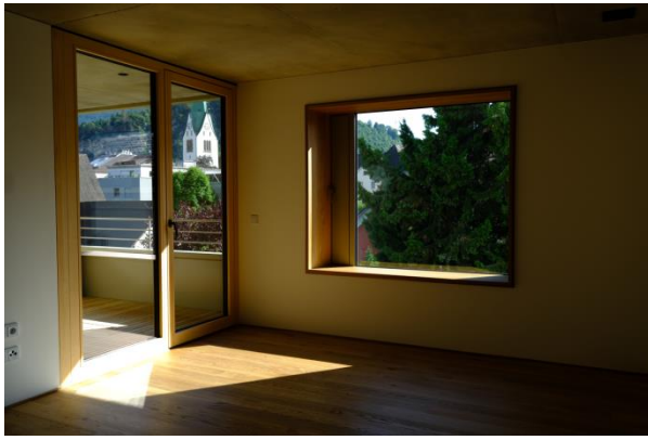
Blick vom Wohnraum zu Sitzfenster und Loggia