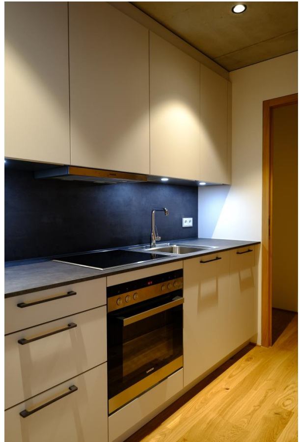
Voll ausgestattete Küche mit Kühl- und Gefrierschrank, dahinter Abstellraum